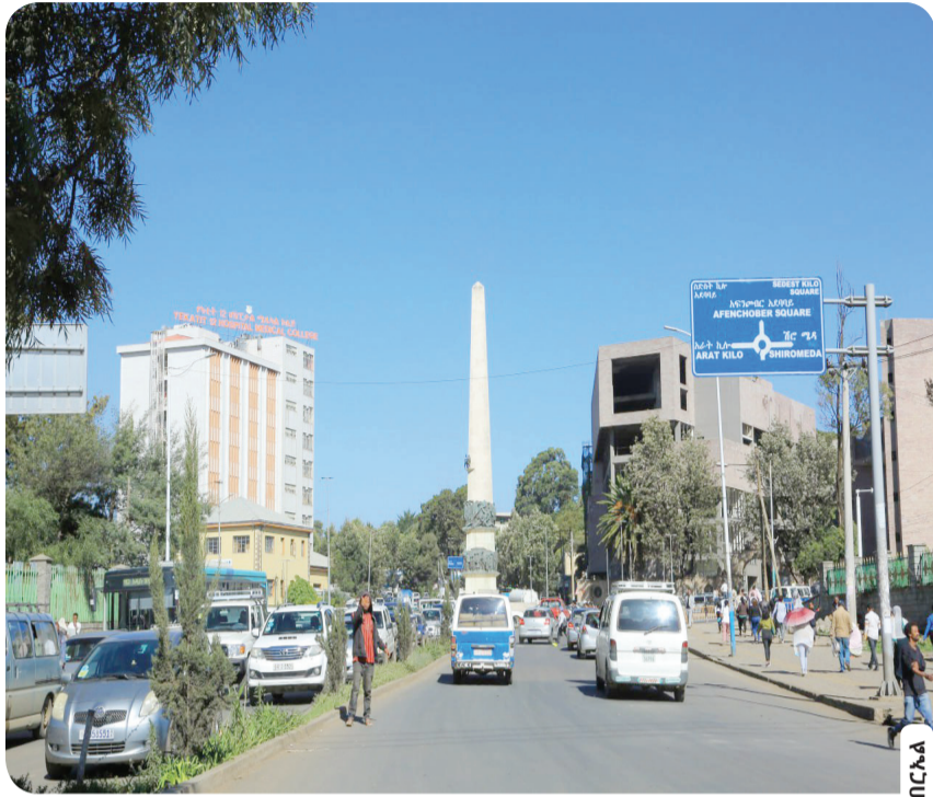
ስድስት ኪሎ ሰፈር የሚገኘው የየካቲት 12 የሰማዕታት መታሰቢያ ሐውልት

ፋሽስት ጣሊያን ስድስት ኪሎ ወደተለያዩ አቅጣጫ ከሚወስዱ መንገዶች አንዳንዶቹን ስያሜያቸውን ቀይሮ ይጠቀምበት እንደነበርም አያሌው (ዶ/ር) ገልፀዋል። ይህም ወደ ምኒልክ የሚወስደውን መንገድ 'ደጋ ሀቡር'፣ ከየካቲት 12 ሆስፒታል ሜዲካል ኮሌጅ ወደ ራስ መኮንን ድልድይ የሚወስደውን መንገድ 'ሬጂና ኤሌና' (ንግስት እሌኒ)፣ ወደ አራት ኪሎ የሚወስደውን መንገድ በወቅቱ በነበረው የጣሊያን አመራር ስም 'ዳካ ዳዎስታ' ብሎ ሰይሞት ነበር። ከዚህ ባለፈ ስድስት ኪሎ አካባቢ