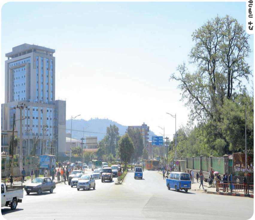
የ6 ኪሎ ሰፈር ከፊል ገፅታ

የሚገኙ ተቋማትን ለአብነት የካቲት 12 ሆስፒታል ሜዲካል ኮሌጅን 'ሬጂና ኤሌና' (ንግስት እሌኒ)፣ የቀድሞ ገነተ ልዑል ቤተ መንግስትን 'ፓላስ ኢምፔሪያል (የኢምፔሪያል መንግስት ቤተ መንግስት)' ብሎ ይጠራው እንደነበርም ታሪክን አጣቅሰው አያሌው (ዶ/ር) አብራርተዋል።