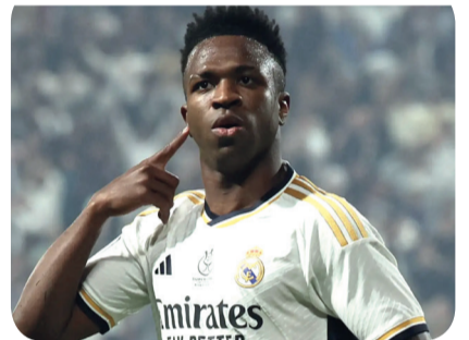
ብራሲላዊ ቪኒሲየስ ጁኒየር

የአለማችን ሀያሉ ክለብ ሪያል ማድሪድ የ2023/2024 የአውሮፓ ሻፒዮስ ሊግ ለ15ኛ ጊዜ ከፍ አድርጎ አንስቷል። በትናንትናው ዕለት ይፋ በሆነው መረጃ መሰረት ቪኒሲየስ ጁኒየር የ2023/24 የአውሮፓ ሻፒዮስ ሊግ የውድድር ዘመኑ ምርጥ ተጫዋች ተብሎ ተመርጧል። ቪኒ ጁኒየር ከሪያል ማድሪድ ጋር 10 የፍጻሜ ጨዋታዎችን አድርጎ 9 የፍጻሜ ጨዋታዎችን ሲያሸንፍ 7 ጎሎችን አስቆጥሯል። 4 ለግብ የሚሆኑ ኳሶችን አቀብሏል። እንደዚሁም በ11 ጎል ተሳትፎ አለው። በጥቅሉ ከማድሪድ ጋር 12 ዋንጫዎችን አሸንፏል። በተለይም በዘንድሮው የሻፒዮስ ሊግ ውድድር ላይ ያሳውን ብቃት የተመለከቱ ብዙዎች የባለንደር አሸናፊ መሆን እንደሚገባው ግምታቸውን አስቆጥመዋል።