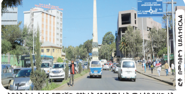
ስድስት ኪሎ ሰፈር የሚገኘው የየካቲት 12 የሰማዕታት መታሰቢያ ሀውልት