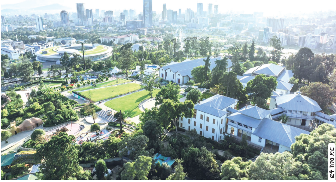
የአዲስ አበባ ከተማ ከፊል ገጽታ

የአዲስ አበባ ከተማ አስተዳደር የመሬት ልማትና አስተዳደር ቢሮ የ2ኛ ዙር የመሬት ሊዝ ጨረታ አሸናፊዎችን ስም ዝርዝር ይፋ አደረገ። በቢሮው የሰማ መሬት ማስተላለፍ ቡድን አስተባባሪ አቶ ሀብታሙ ተስፋዬ፣ ከግንቦት 12 ቀን 2016 ዓ.ም እስከ ግንቦት 17 ቀን 2016 ዓ.ም ድረስ በይፋ ተከፍቶ አሸናፊዎቹ የተለየው የ2ኛው ዙር የመሬት ሊዝ ጨረታ አሸናፊዎች ስም ዝርዝር ይፋ መደረጉን ገልፀዋል። አቶ ሀብታሙ በማብራሪያቸው በዚህ ጨረታ ዝቅተኛ ዋጋ የተመዘገበው በንፋስ ስልክ ላፍቶ ክፍለ ከተማ ሲሆን፣ ይህም በካሬ ሜትር 20 ሺህ 100 ብር ነው ብለው፣ ከፍተኛው በቁርቆስ ክፍለ ከተማ መሆኑንና በካሬ ሜትር 478 ሺህ ብር እንደሆነ ገልፀዋል። አክለውም፣ ለ4 ሺህ 201 ተጫራቾች የጨረታ ሰነድ በአን ላይን መሸጣቸውን ጠቅሰው፣ ከእነዚህ ውስጥ 2 ሺህ 972 ሰነዶች ተሞልተው ተመላሽ ሆነዋል ብለዋል። 1ኛ የወጡ አሸናፊ ተጫራቾች የጨረታው ውጤት በአዲስ ልሳን ጋዜጣ ታትሞ ከወጣበት ጊዜ ጀምሮ ባሉት አስር ተከታታይ የሥራ ቀናት ውስጥ ለም ሆኑል አካባቢ በሚገኘው ኤምኤ