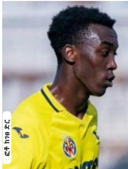
ፎቶ ከገፀ ፎር