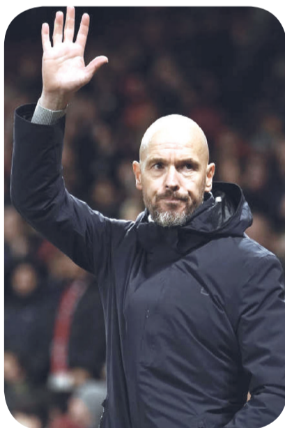
የማንቸስተር ዩናይትድ አሰልጣኝ ቴን ሀግ