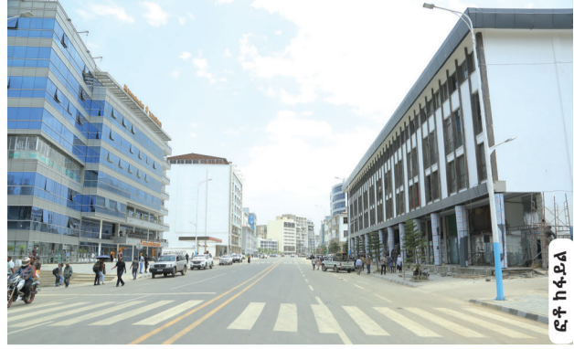
በኮሪደር ልማት ስራ አራት ኪሎ የተገናፀፈችው ገጽታ

ልማቱ የትራፊክ መጨናነቅን በማቃለል ምርታማነትን ለማሳደግ እንደሚያግዝ ተገለፀ 3