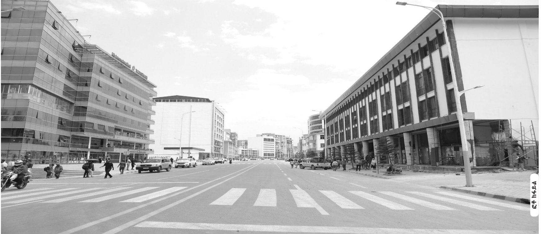
በኮሪደር ልማት ስራ አራት ኪሎ የተገናኝቶ ገጽታ